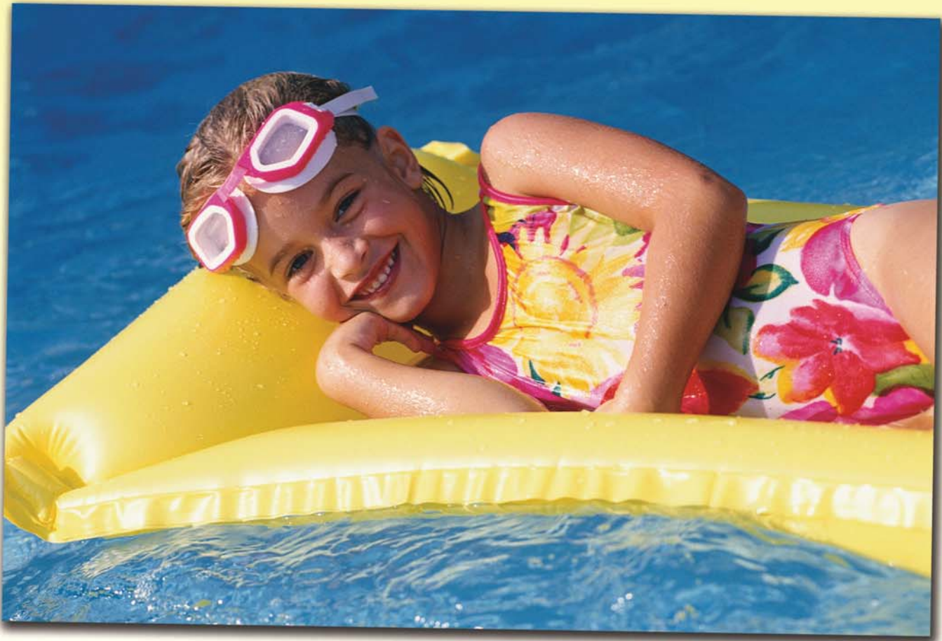
Photo depicts a model, whose licensed image is for illustrative purposes only.

¡Tocar e los niños en la “zona del traje de baño” está PROHIBIDO POR LA LEY!